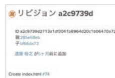
チケットに関連するリポジ션을表示