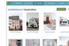
様々な種類のファイルを保存できる