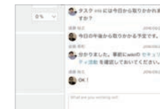
チケットにチャットのログも表示