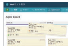
ドラッグ&ドロップで操作