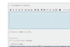
チケットからメールを返信できる