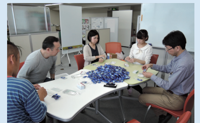
イベントに向けてノベルティグッズを準備中