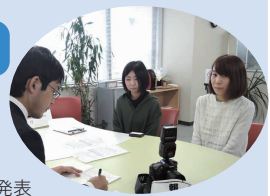
記者の取材を受けている様子