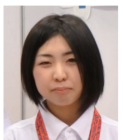
【システム開発 石川】

今年もMy Redmine、MySubversion共によりよろしくお願い致します。